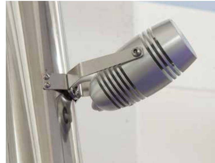
Fusolo (Maestrale, Scirocco)